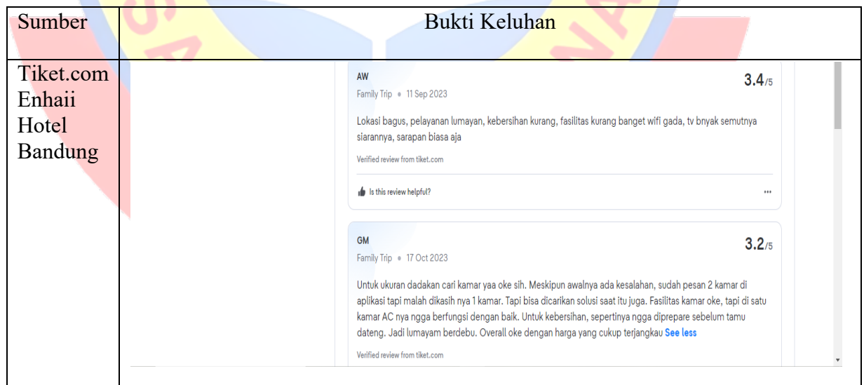
Tabel 1. 2 Ulasan Tamu Terhadap Enhaii Hotel Bandung