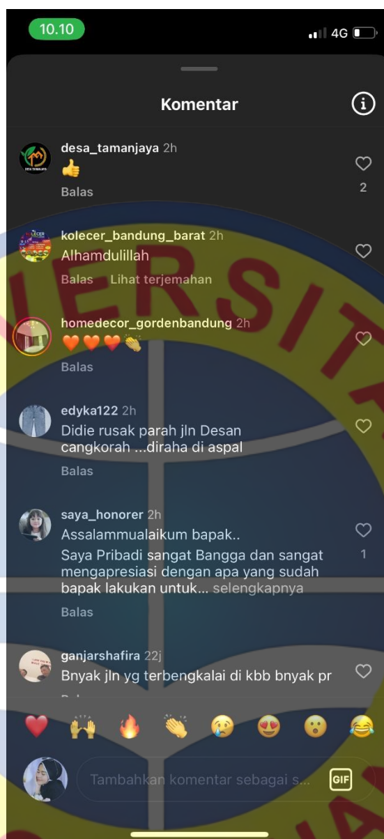
Gambar 1. 3 Komentar dari Postingan Akun Instagram @prokompim_kbb