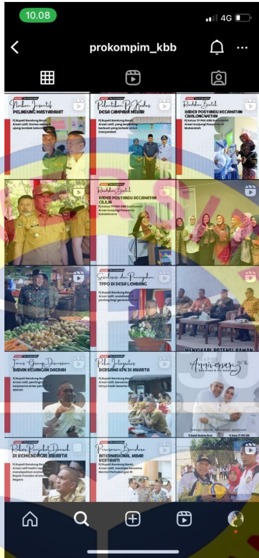
Gambar 1. 2 Postingan dan Konten Instagram @prokompim_kbb