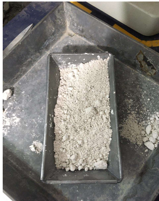
Gambar 4. Steel Slag