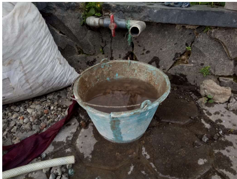
Gambar 6. Air Bersih