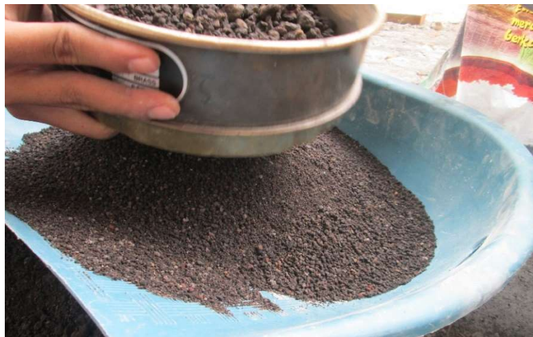
Gambar 2. Agregat Halus