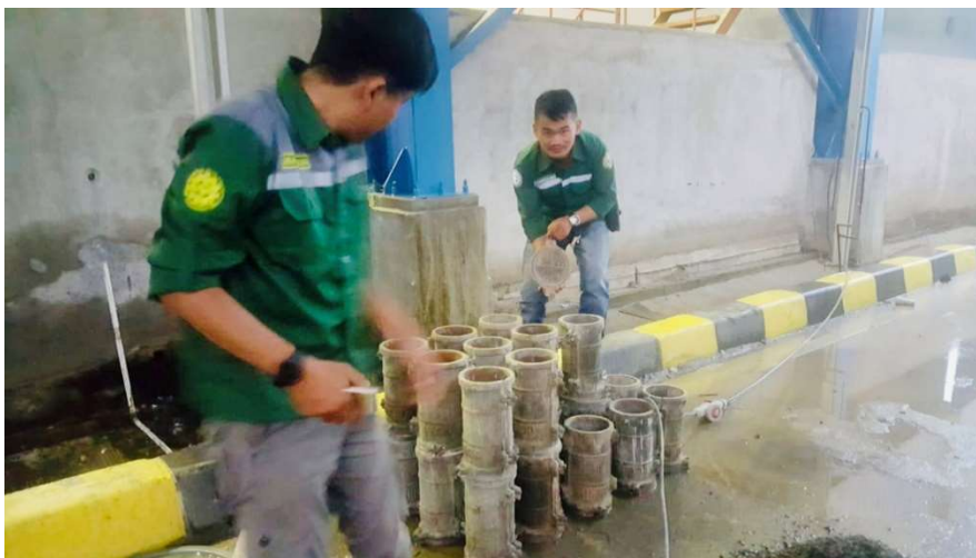
Gambar 12. Cetakan Silinder