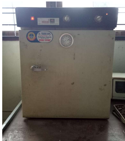
Gambar 14. Oven