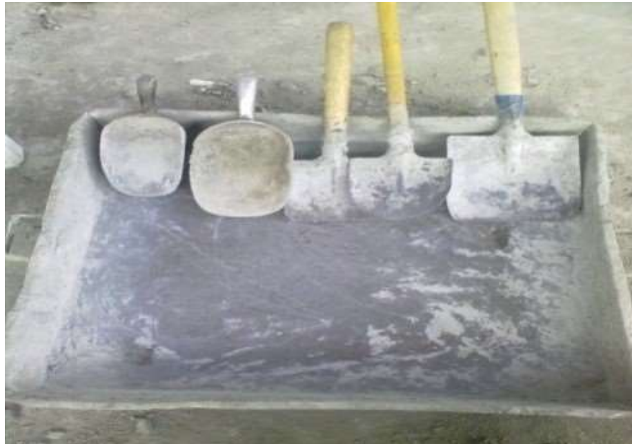
Gambar 17. Sekop dan Alas Baja