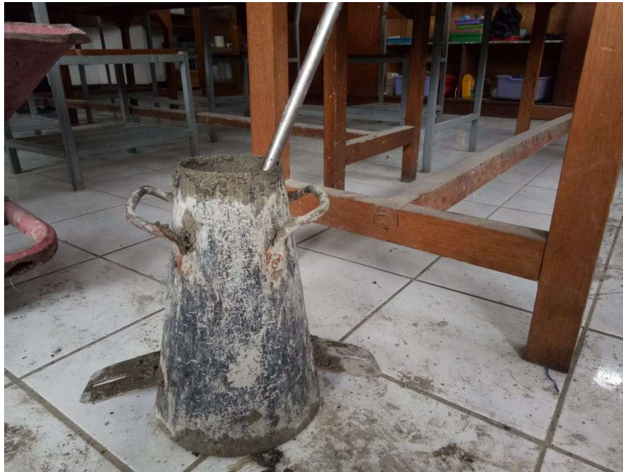
Gambar 13. Kerucut Abrams & Tongkat Pematat