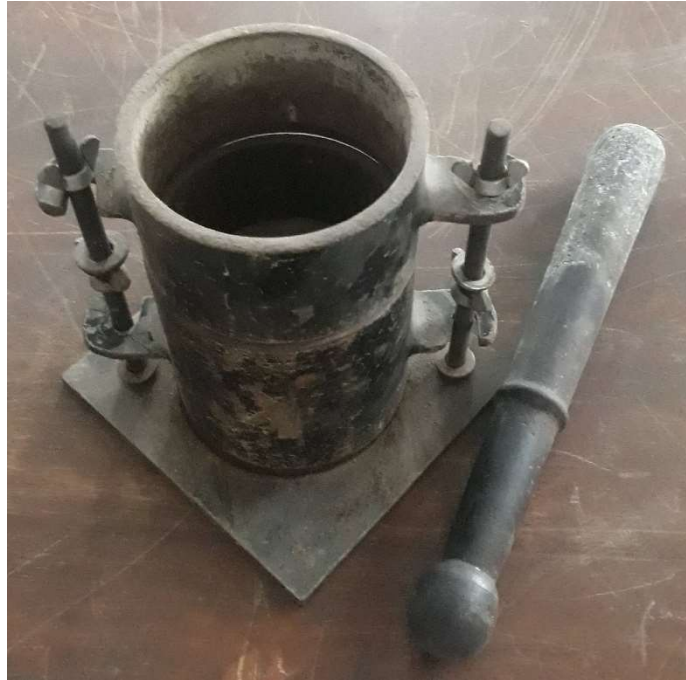
Gambar 11. Gambar Silinder Baja Pemasat