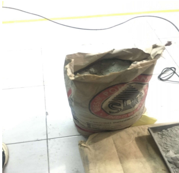
Gambar 5. Semen Portland Type 1