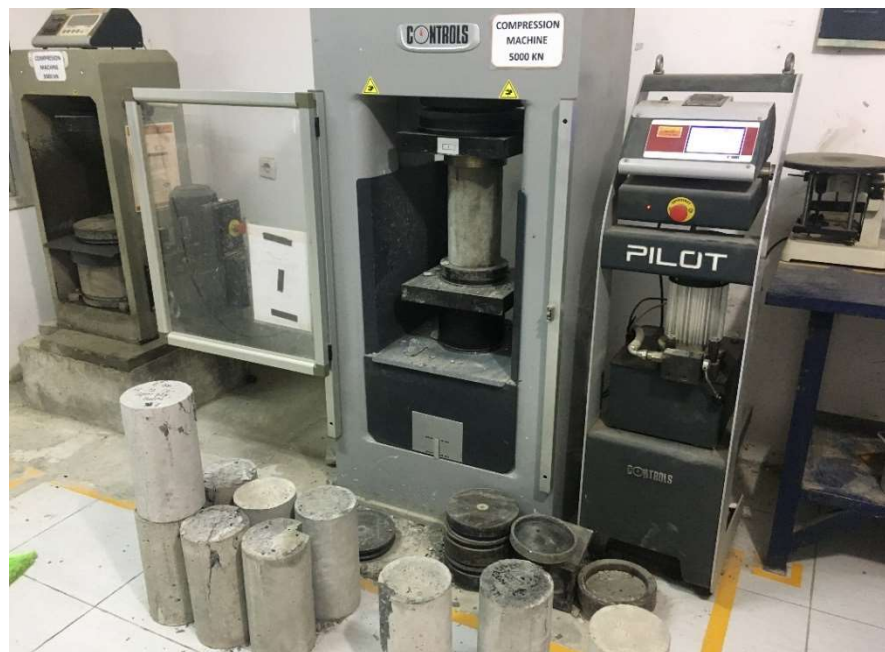
Gambar 16. Mesin uji kuat tekan PT. Waskita Beton Precast