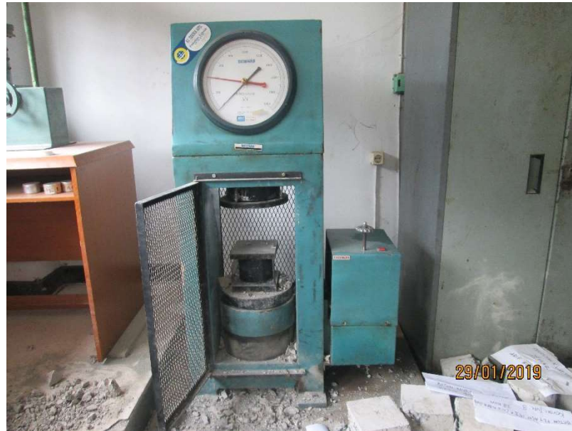
Gambar 15. Mesin Uji Kuat Tekan