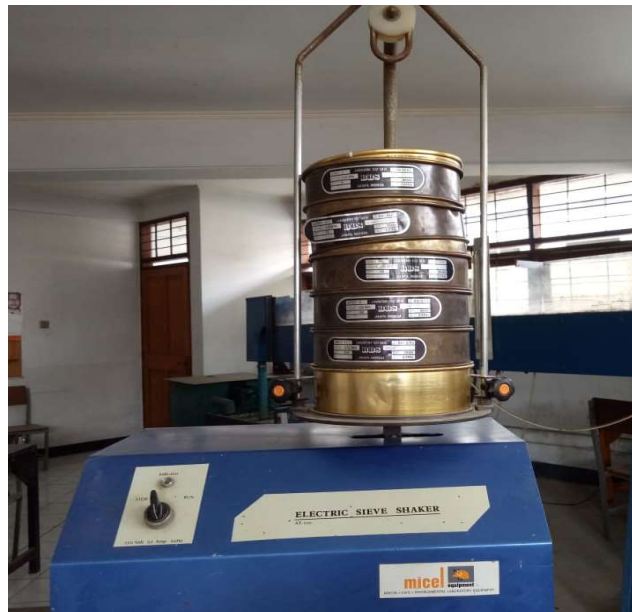
Gambar 8. Saringan & Mesin Pengayak