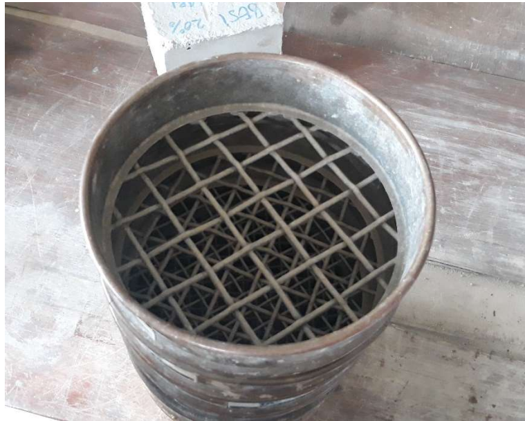
Gambar 9. Saringan Agregat Kasar