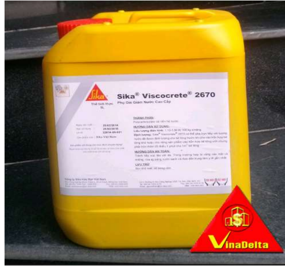
Gambar 3. Superplasticizer