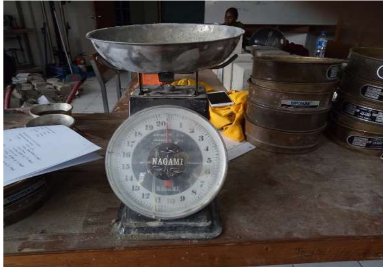
Gambar 7. Timbangan