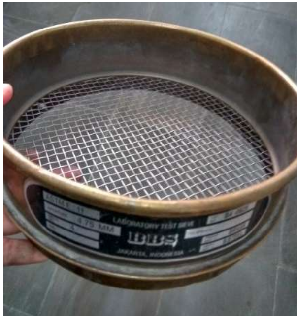
Gambar 10. Saringan Agregat Halus