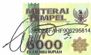
Emi Malihatur Rosidah

Bandung, September 2020 Yang membuat pernyataan,