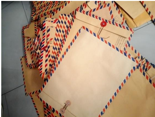
Berkas Lamaran Yang Terkumpul