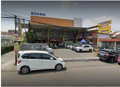
Gedung Toserba Borma