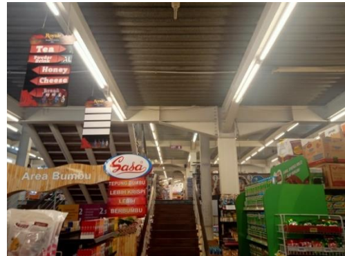
Bagian Dalam Area Supermarket